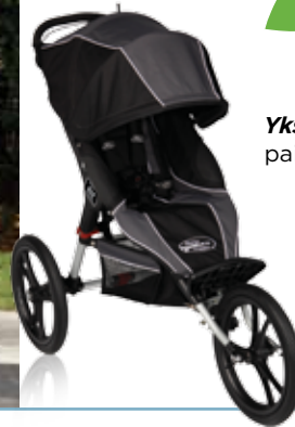
Yksöisrattaa - painosuositus enint. 34 kg