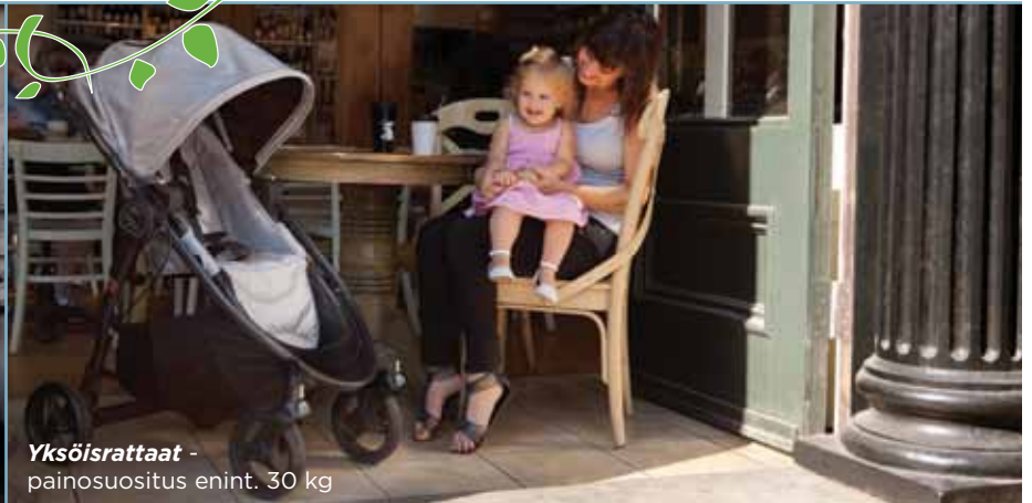
Yksöisrattaat - painosuositus enint. 30 kg