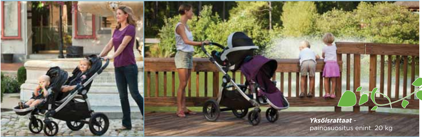
Yksöisrattaat - painosuositus enint. 20 kg